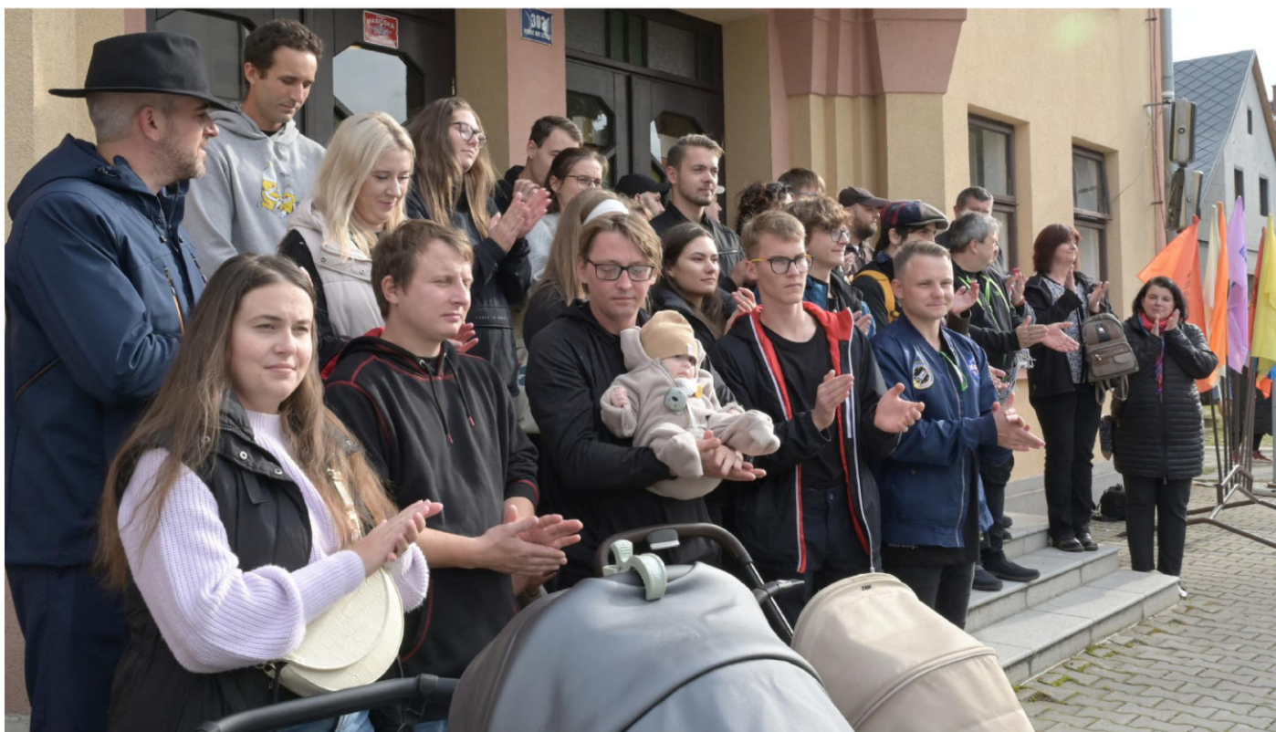
V pátek odpoledne zažilo Vysoké letošní první a hned dvojité vítání