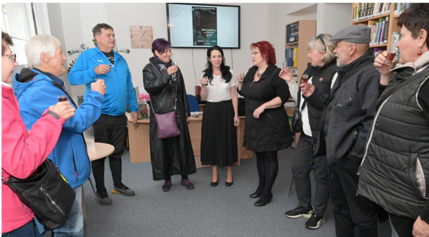
Návštěva sprátené přehlídky z Hronova v informačním středisku KDP